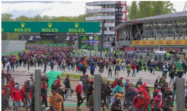
Il bagno di folla al termine del Gran Premio dello scorso anno

del mondo di e-mountain bike (10-11 giugno, Monghidoro), Europei seniores di bowling (24 giugno-1 luglio, Modena-San Lazzaro), Finali Not in My House (10-12 luglio, Bologna), European Aerobic Championship - Campionati europei di volo acrobatico (Pavullo nel Frignano, 3-17 settembre), Davis Cup by Rakuten (14-17 settembre, Unipol Arena), Finali nazionali di atletica under 23 (30 settembre-1 ottobre, Modena), Giro dell'Emilia (30 settembre), Europei master di Ultimate Frisbee (12-15 ottobre, Bologna).