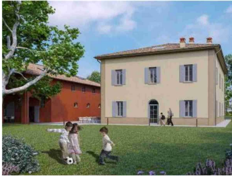
Il rendering della struttura di proprietà della Fondazione Carisbo